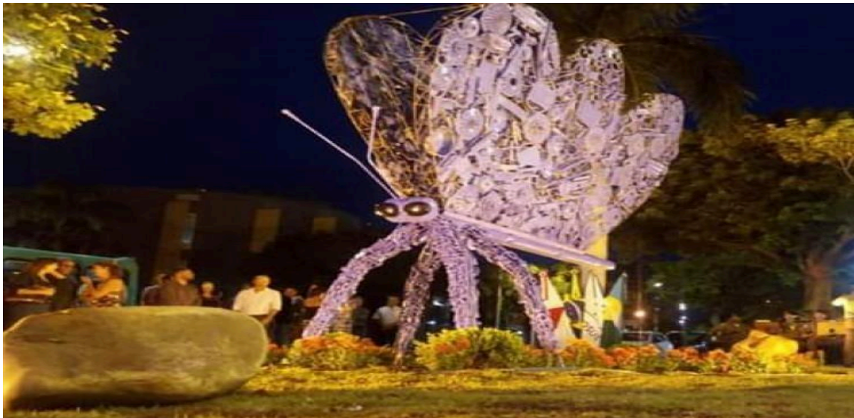
Figura 01: Borboletas de sucata produzidas por integrantes do PAP, em 2019.

inserção de egressos do sistema penitenciário, apenados em regime semiaberto e aberto e pessoas em situação de rua. Entretanto, observa-se nas referidas normativas que o programa é tecido por uma rede de instituições, das várias camadas da sociedade (Montes Claros, 2019).