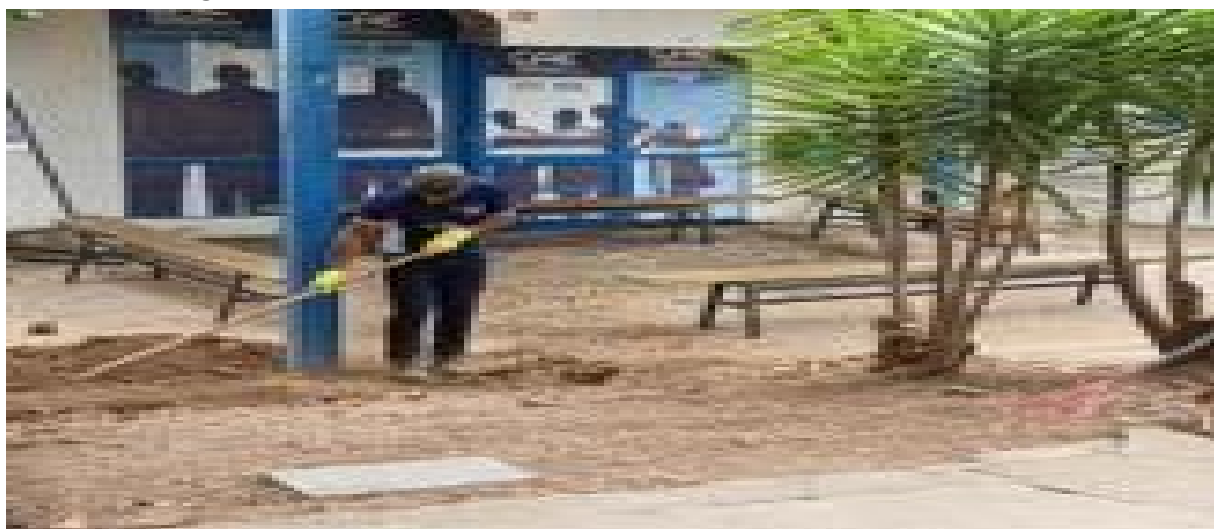
Figura 04: Reforma estruturas internas da UNIMONTES, em 2019