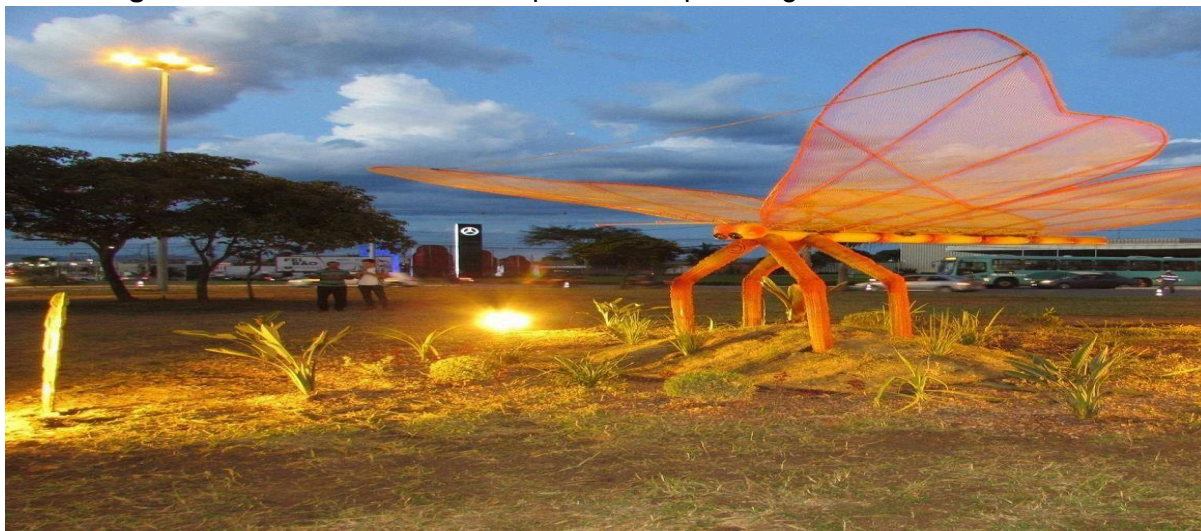
Figura 03: Borboletas de sucata produzidas por integrantes do PAP, em 2019