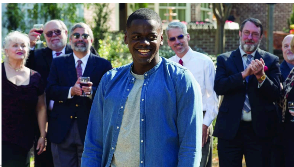
Figura 3 - Cena do filme Corra! (2017)

Mais a frente ao decorrer da trama, quando temos a maior parte dos personagens apresentados, na residência da Rose, Chris nota que todos os funcionários são pessoas negras, para uma família que se diz não racista esse fato mostra a clássica representação de estereótipos antigos de que pessoas negras são inferiores e devem servir as raças puritanas e superiores da supremacia branca, onde toca a ferida de uma massa que tem marcada na história uma escravidão que nunca será esquecida.