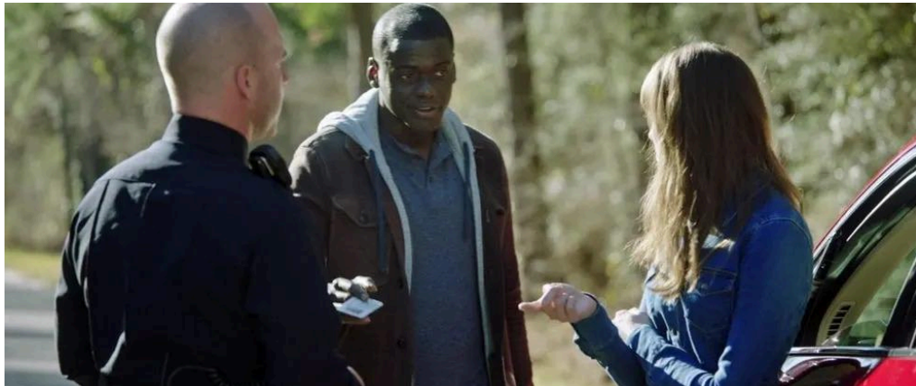
Figura 1 - Cena do filme Corra! (2017)

Assim que se entende todo o contexto geral por trás do racismo enraizado e abordagens do Peele, a base de coleta de cenas do próprio longa, vamos discutir e analisar detalhes importantes que deram toda a forma e grandeza para esse roteiro de muito sucesso e reconhecimento sobre a precisão da abordagem do tema.