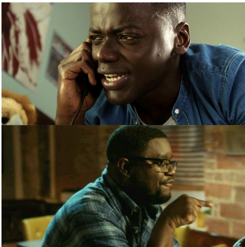
Figura 6 - Cena do filme Corra! (2017)