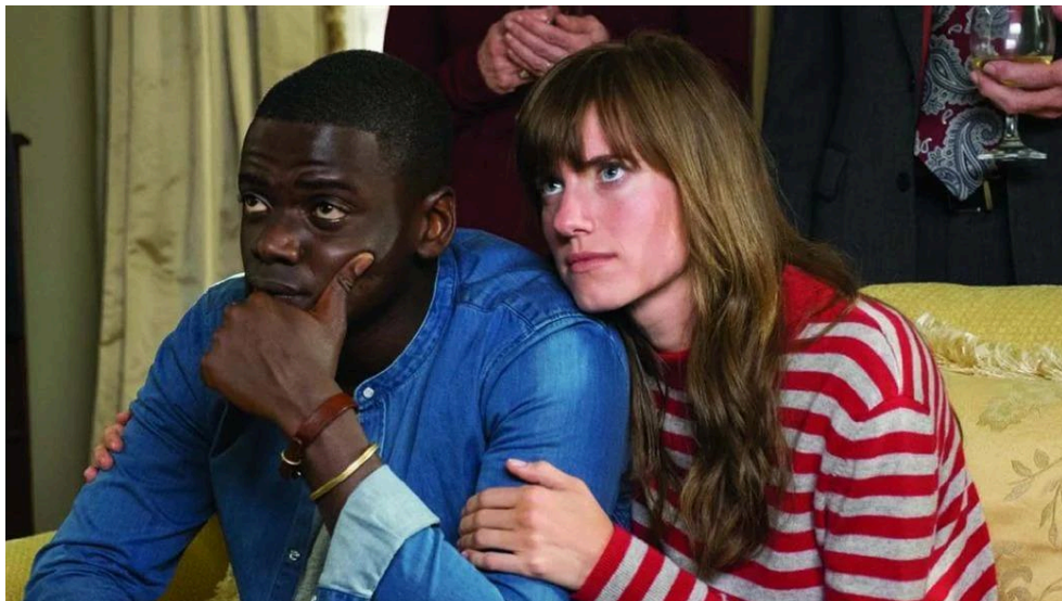
Figura 5 - Cena do filme Corra! (2017)

incomodo, estar em segundo plano e sem controle do seu próprio corpo, cada detalhe da cena faz com que essa sensação seja transmitida de maneira mais forte, luzes fechadas, ângulo olho a olho com o expectador, olhos vidrados e lágrimas escorrendo mas sem esboçar nenhuma expressão além de choque e pânico, tudo minuciosamente trabalhado para fortalecer essa identificação de dor do personagem.