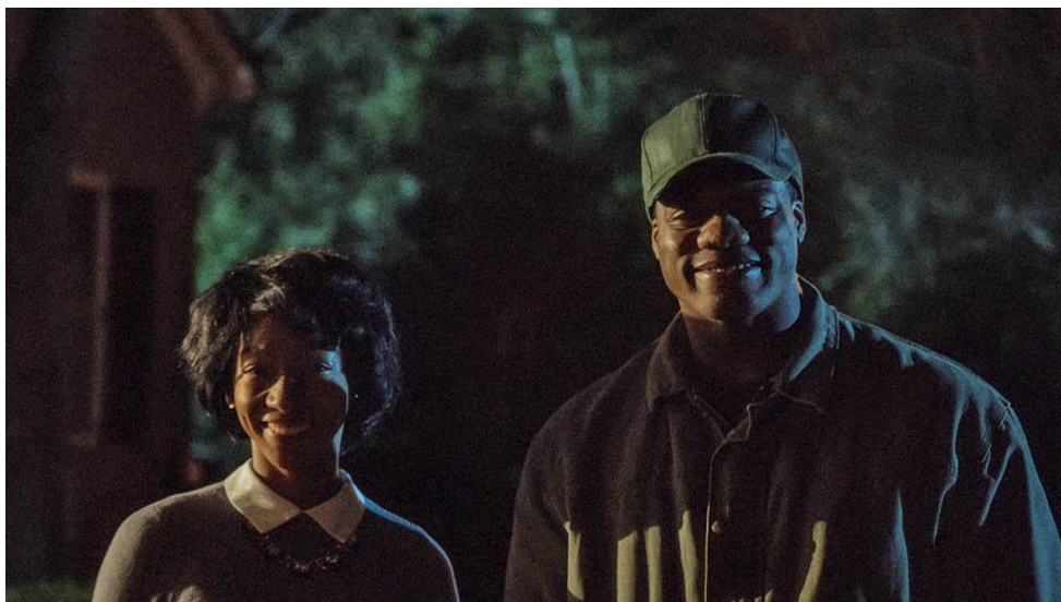
Figura 2 - Cena do filme Corra! (2017)